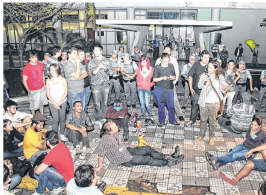
Em uma assembleia de mais de três horas em frente à prefeitura, o prefeito Rodrigo Agostinho (PMDB) conversa com o grupo "Bauru Acordou", responsável por três atos de protesto na cidade. Em cena inusitada, o chefe do Executivo ouviu as reivindicações sentado na calçada. Na onda dos "pacotões" de propostas, Rodrigo anuncia o dele, porém, não agrada aos manifestantes.