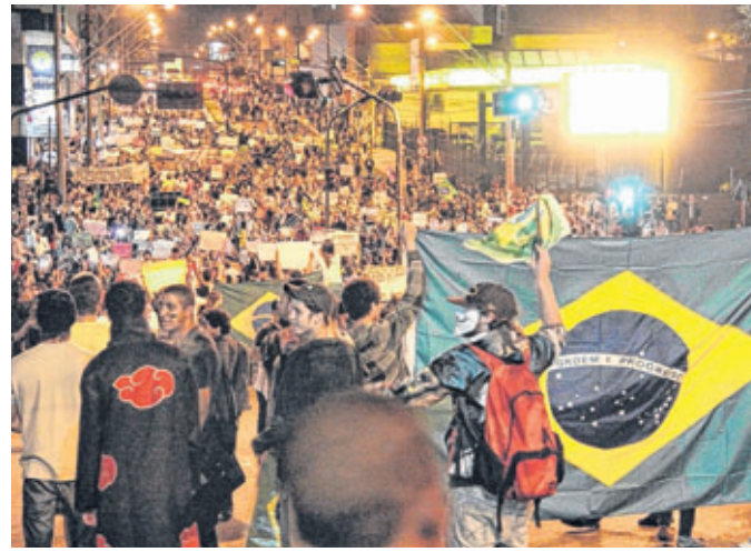
Manifestantes na avenida Rodrigues Alves após saída da Praça Rui Barbosa: eles não foram até a prefeitura