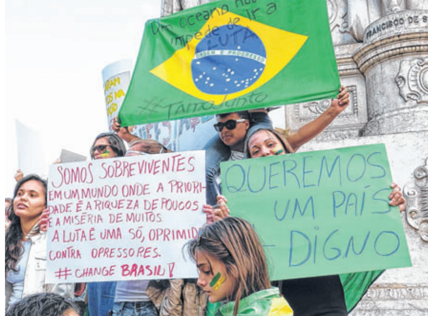
Em Portugal, brasileiros se concentram na frente do consulado