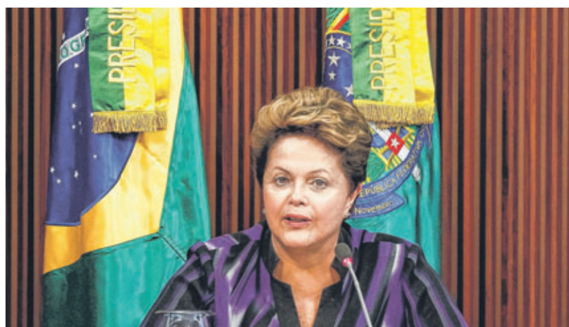
A presidente Dilma Rousseff propõe um debate sobre a convocação de um plebiscito para fazer uma reforma política via Constituinte e conchama os governos estaduais e municipais para um pacto pela estabilidade fiscal. A proposta vem em resposta aos protestos que tomaram as ruas do País. No embalo das manifestações, entidades lançam campanha para mudar sistema eleitoral.

As manifestações tomam as ruas das principais Capitais do País e inúmeras cidades em meados de junho. Em Brasília, Rio de Janeiro, Belo Horizonte e Porto Alegre houve confrontos entre a Polícia Militar e os manifestantes. Na Capital Federal, 7 mil jovens cercaram o Congresso. Em vários países, brasileiros foram às embaixadas. Em Bauru, os manifestantes se concentraram na Praça Rui Barbosa e depois seguiram em passeata até a Câmara Municipal, onde ficaram a maior parte do tempo. Na sede do Poder Legislativo, parte deles pressionou os vereadores a assinar a proposta de CEI do Transporte Coletivo, impedindo-os de deixar o prédio. Os vereadores só saíram do local por volta de 23h, após negociações e com o compromisso de fazer uma reunião com uma comissão para discutir o assunto.