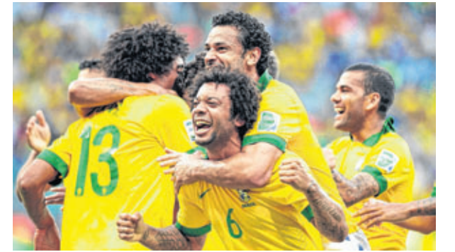
Com uma atuação convincente, a Seleção Brasileira venceu a Itália por 4 a 2, em Salvador. O resultado classificou o Brasil em primeiro lugar no Grupo A da Copa das Confederações.