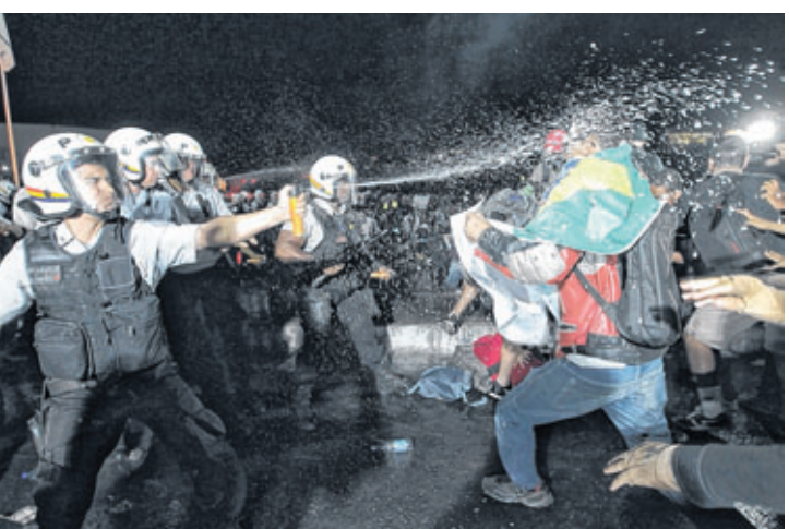
Polícia usa spray contra ativistas mais exaltados na Esplanada dos Ministérios em Brasília: momento de tensão