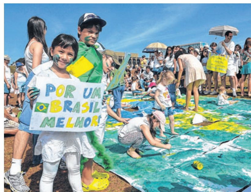
Mais de 200 crianças de várias idades, acompanhadas dos pais, realizam um ato político em frente ao Congresso Nacional, dia 23 de junho. Os pequenos cidadãos exerceram a prática da boa política, ontem, ao pintarem cartazes que pedem um Brasil digno.

“Os pacientes são os verdadeiros super-heróis, cujo poder é acreditar na cura.”