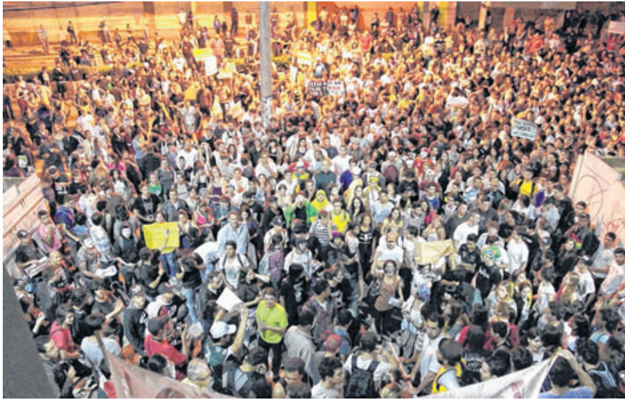
Multidão se posiciona em frente à Câmara de Bauru como forma de adesão à onda de protestos no Brasil