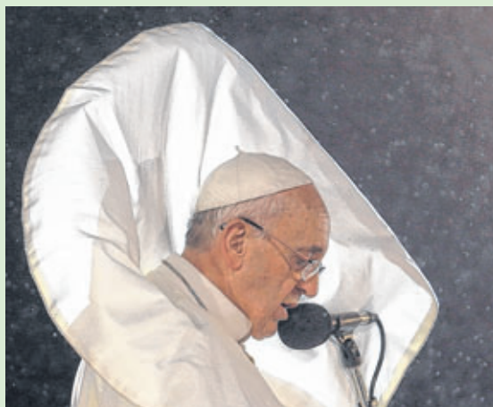
Papa Francisco enfrentou o tempo frio, com chuva e vento na praia de Copacabana

Em um português com leve sotaque e estilo coloquial, o papa Francisco se sucedeu à presidente Dilma no Palácio Guanabara para exaltar, em discurso, a importância dos jovens, a quem chamou de "menina dos olhos". O pontífice afirmou que veio ao Brasil para se juntar a jovens de todo o mundo, que foram atraídos ao País pelo braços do Cristo Redentor. Na despedida, o papa expressou a esperança no fortalecimento da "fé cristã" entre os brasileiros. Francisco ainda pediu para que os jovens saiam às ruas e disseminem a fé entre as pessoas. Nas fotos, cenas da passagem do papa Francisco pelo Brasil.