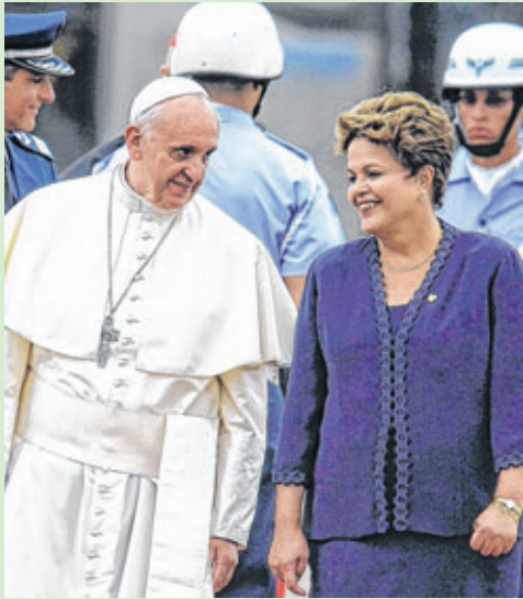
Papa é recebido pela presidente Dilma