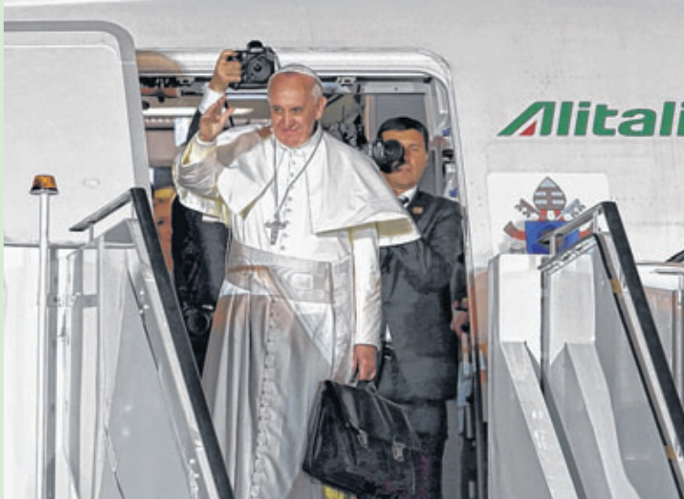
Papa Francisco embarca no aeroporto do Galeão, no Rio de Janeiro, para o Vaticano, após Jornada Mundial da Juventude

Em um português com leve sotaque e estilo coloquial, o papa Francisco se sucedeu à presidente Dilma no Palácio Guanabara para exaltar, em discurso, a importância dos jovens, a quem chamou de "menina dos olhos". O pontífice afirmou que veio ao Brasil para se juntar a jovens de todo o mundo, que foram atraídos ao País pelo braços do Cristo Redentor. Na despedida, o papa expressou a esperança no fortalecimento da "fé cristã" entre os brasileiros. Francisco ainda pediu para que os jovens saiam às ruas e disseminem a fé entre as pessoas. Nas fotos, cenas da passagem do papa Francisco pelo Brasil.