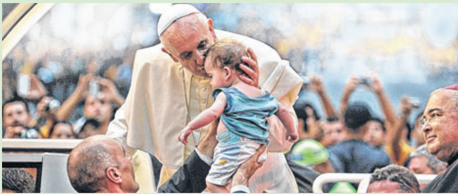
O papa Francisco beija criança durante carreta, no Rio