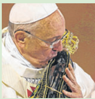
Papa beija imagem de Nossa Senhora Aparecida e promete voltar ao País em quatro anos