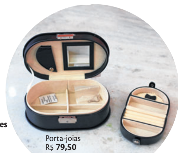
Porta-joias R$ 79,50