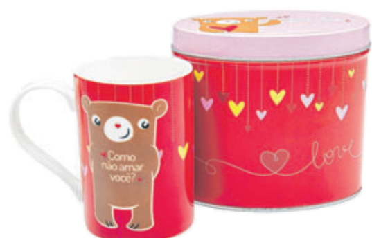
Caneca e lata R$ 39,80