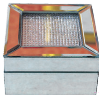
Porta-joias R$ 87,50