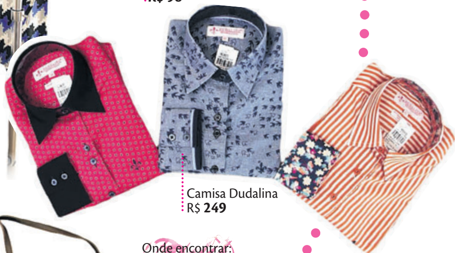
Onde encontrar: Pedágio (14) 3223-5857