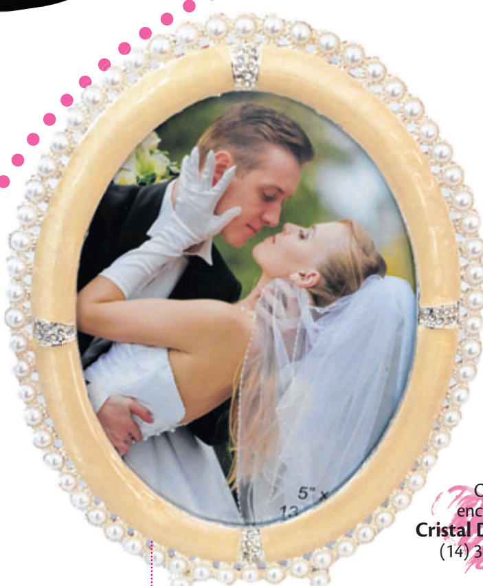
Porta-retrato R$ 77