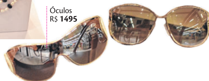
Óculos R$ 1495