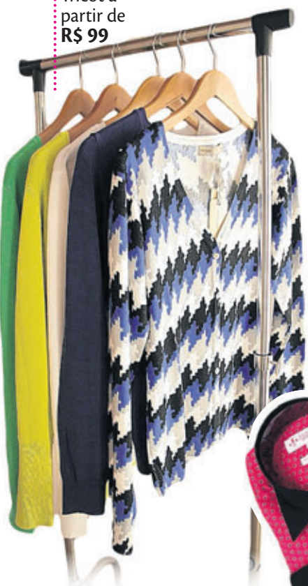
Tricot a partir de R$ 99