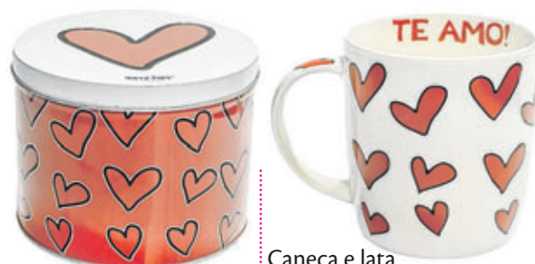
Caneca e lata R$ 36,80