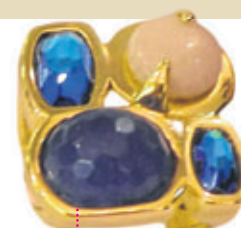
Anel R$ 199 Onde encontrar: Nair Santos Ótica E Joalheria (14) 3203-3531 3879-7764 3622-7311 (Jaú)