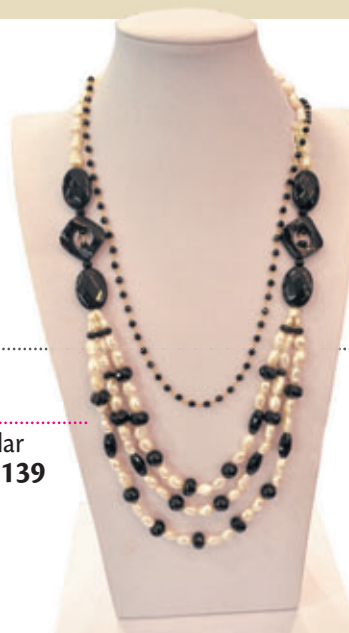
Colar R$ 139