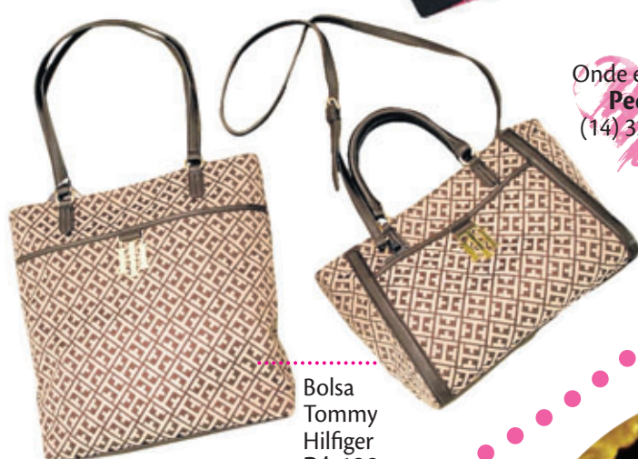
Bolsa Tommy Hilfinger R$ 199