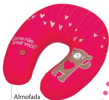
Almofada R$ 76,80