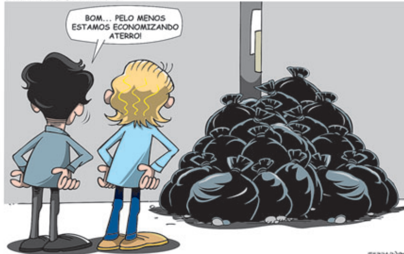
LIXO ACUMULADO NAS RUAS