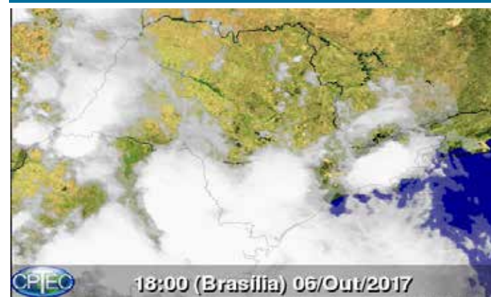
IMAGEM DO SATÉLITE GOES

Os radares meteorológicos do IPMet/Unesp, instalados em Bauru e Presidente Prudente, estão detectando áreas de chuvas isoladas com intensidades moderadas/fortes no Estado de São Paulo.