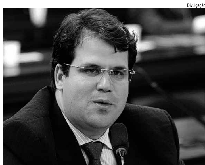
Deputado Aureo (RJ) fala em compromisso com o trabalhador

namento desta nova estação, a água do Rio São Francisco será elevada a 58,5 metros de altura, o equivalente a um prédio de 19 andares. A expectativa, segundo o governo, é que até o final deste ano, mais de 7 milhões de pessoas dos Estados de Pernambuco, Ceará, Paraíba e Rio Grande do Norte recebam as águas do São Francisco.