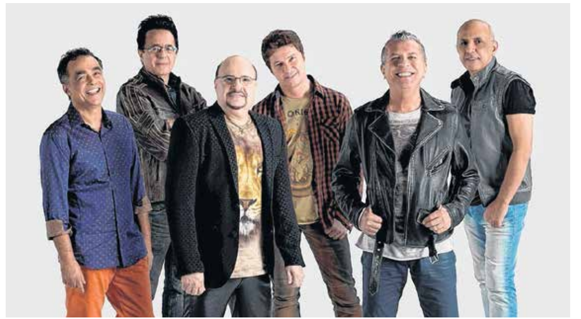
De volta para o futuro - Roupa Nova reencontrará público de Bauru e região no 2º semestre

Mais informações: (14) 9 8154-7838 e (14) 9 9629-6344. Realização: Vt Produções e Br Eventos.