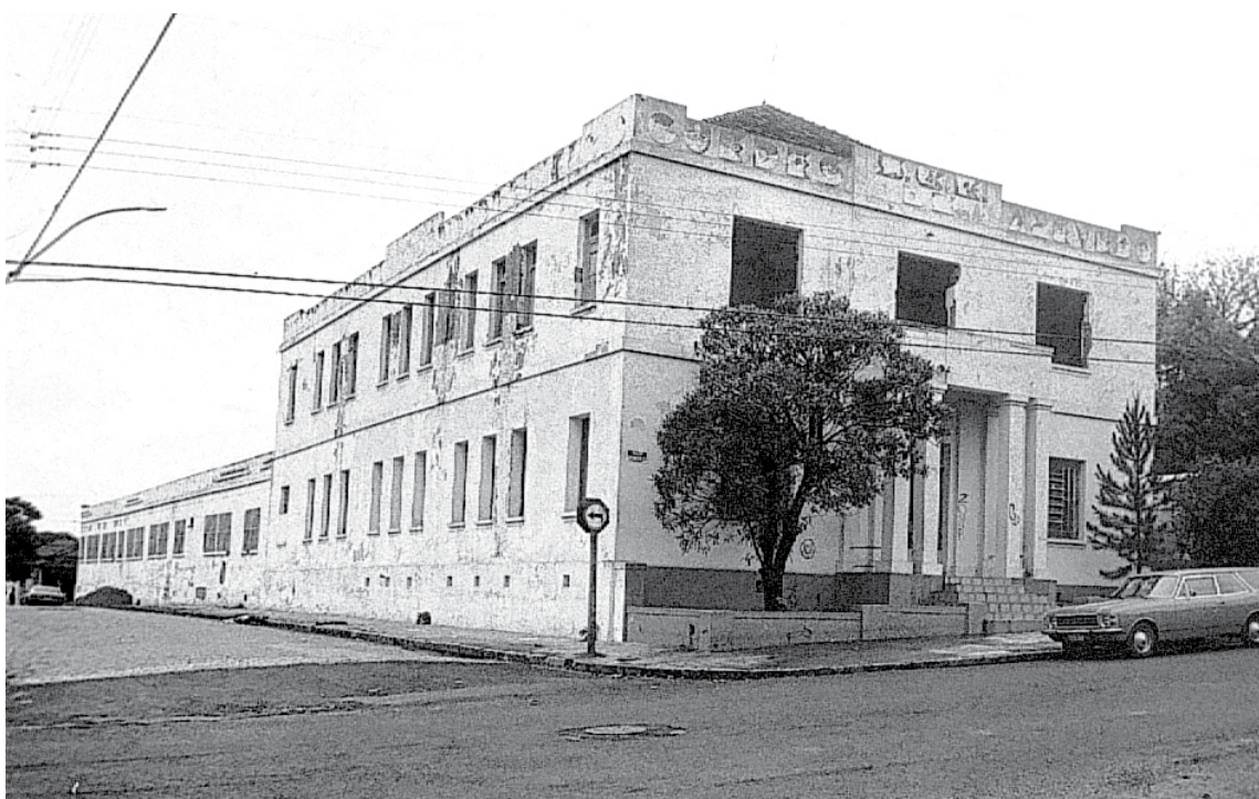
Fachada do antigo prédio do Guedes de Azevedo