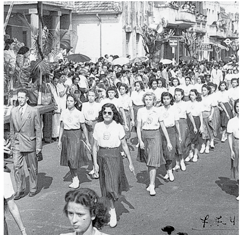
Nos desfiles patrióticos, o Guedes sempre foi destaque

Acreditamos que muitos bauruenses que frequentaram o tradicional Guedes de Azevedo da Rua Antônio Alves, vão se lembrar e muito da passagem por aquele histórico estabelecimento de ensino, na época um dos mais importantes do Interior e que hoje é recordado pelos que o frequentaram.