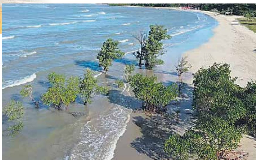
Quinta Praia de Morro de São Paulo

Ao lado norte da vila de Morro de São Paulo há também a Praia do Porto de Cima, Praia da Ponta da Pedra e a Praia da Gamboa. Estas praias são mais conhecidas pelos moradores e pouco frequentadas pelos turistas.