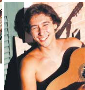
Artista soma cerca de 650 mil ouvintes mensais no Spotify

O show acontece no próximo sábado (17), às 20h, no auditório do Sesc Bauru, com classificação indicativa de 12 anos. Os ingressos custam R$