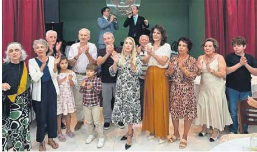
Parabéns aos aniversariantes do mês de abril!